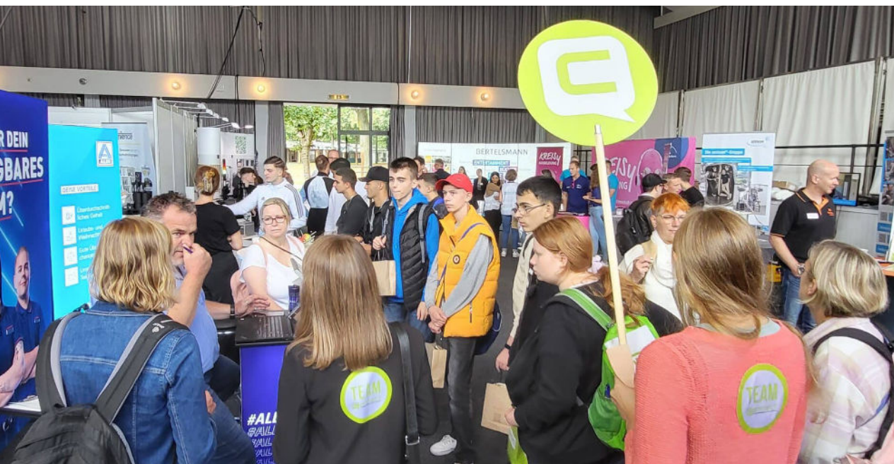
Berufseinstiegsmesse Connect in Präsenz Sep. 2023 mit 205 Ausstellenden und circa 5.000 Besuchenden

Maßnahmen und Informationen zur Berufsorientierung gibt es bereits seit vielen Jahren. In den Kreisen Paderborn und Höxter hat sich hierzu ein starkes Netzwerk etabliert – bestehend aus der Agentur für Arbeit, den Industrie- und Handelskammern, den Kreishandwerkerschaften, den Schulämtern sowie den Kommunalen Koordinierungen KAOA. Im Kreis Paderborn ist die Kommunale Koordinierung im Sachgebiet „Übergang Schule-Beruf“ des Bildungs- und Integrationszentrums verankert. Gemeinsam wurden über die Jahre zahlreiche Projekte auf den Weg gebracht, darunter auch Berufseinstiegs messen in beiden Kreisen.